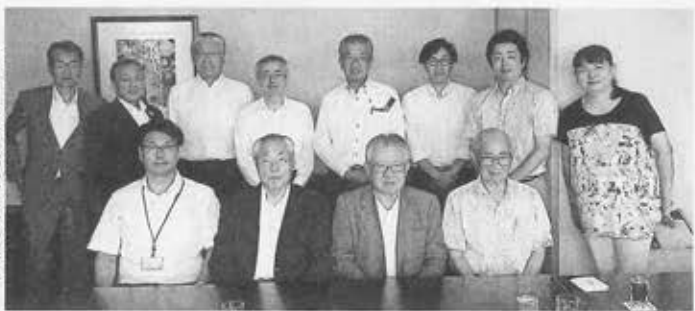
神奈川台場地域活性化推進協会の会員