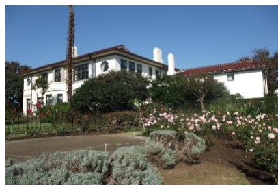
横浜市イギリス館 (横浜市指定文化財)

参加費 ：3,000円(一般) / 2,500円(ヨコハマヘリテイジサポートクラブ会員)